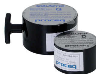
Для ударного устройства