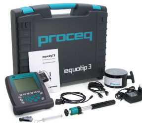
353 10 300 комплектация G