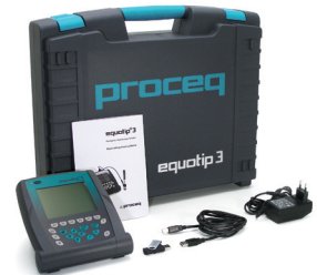
353 10 050 базовая комплектация