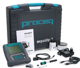
353 10 100 комплектация D

Базовая комплектация EQUOTIP 3 (№ для заказа 353 10 050) подразумевает комбинацию с различными датчиками для создания прибора с необходимым пользователю набором функций, который отвечает специфике работы пользователя