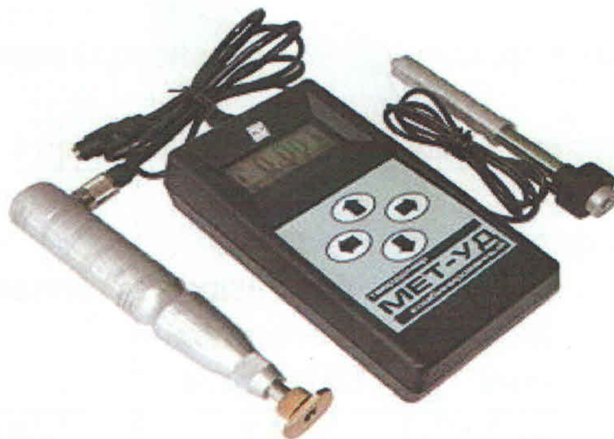
Рисунок 1 – Внешний вид твердомера МЕТ-УД

Внешний вид твердомера МЕТ-УД приведён на рисунке 1, схема пломбировки от несанкционированного доступа на рисунке 2.