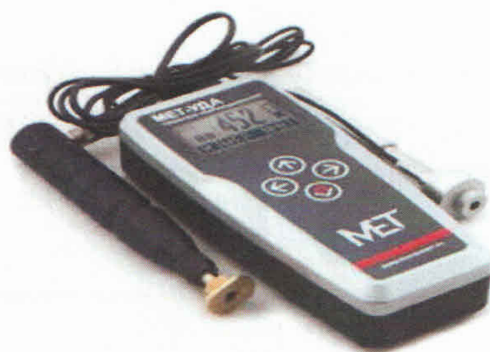
Рисунок 3 – Внешний вид твердомера МЕТ-УДА

Внешний вид твердомера МЕТ-УДА приведён на рисунке 3, схема пломбировки от несанкционированного доступа на рисунке 4.