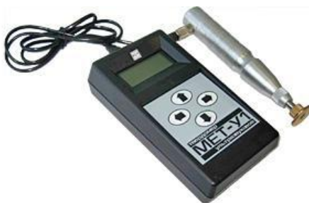
Рисунок 1 – Внешний вид твердомера МЕТ-У1

Внешний вид твердомера МЕТ-У1 приведён на рисунке 1, схема пломбировки от несанкционированного доступа на рисунке 2.