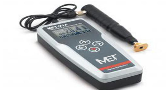
Рисунок 3 – Внешний вид твердомера MET-U1A