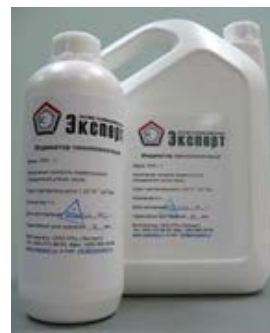
Индикатор пенопеночный ППИ-1