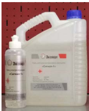
Гель для УЗК «Сигнал-1»