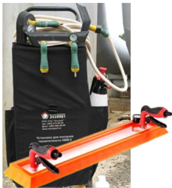
Установка для контроля герметичности и рамки вакуумные

УШС-2; УШС-3; КМС-3-16; Шаблон Ушерова-Маршака; УШК-1; Образцы шероховатости; Лупа измерительная ЛИ-3-10 с подсветкой; ГЛК-1; ГЛК-2; ГЛК-3