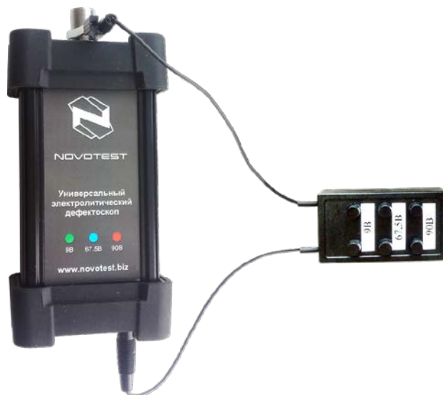
Рисунок 1.3 – Подключение блока тестирования к прибору

Для проверки работоспособности прибора необходимо к электронному блоку подсоединить блок тестирования (рис. 1.3).