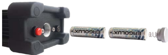
Рисунок 2.1. – Установка аккумуляторных батарей