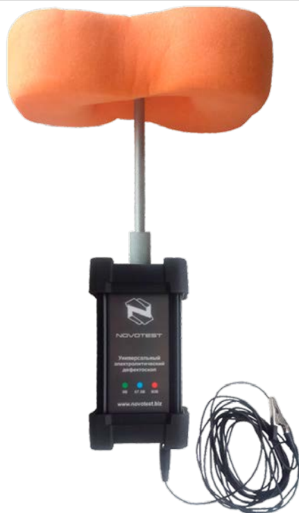
Рисунок 2.3 – Подключение кабеля заземления и губки к электронному блоку электролитического дефектоскопа NOVOTEST ЭД-3Д