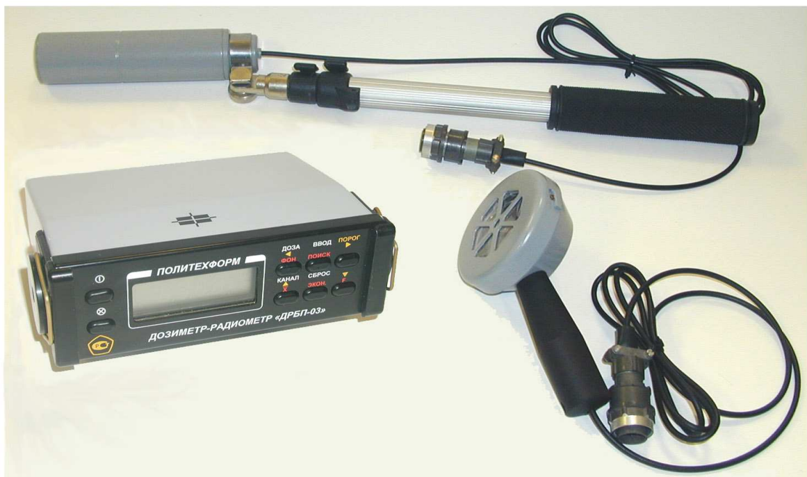
Рисунок 1 - Внешний вид дозиметра с блоками детектирования и штангой

Дозиметр комплектуется удлинительной штангой и блоком зарядки аккумулятора. Внешний вид дозиметра и места пломбировки приведены на рисунках 1 и 2.